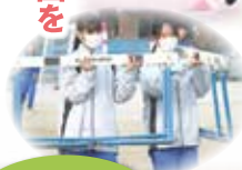
二次元コードを読み取ると陸上競技部のコメントが見られます。